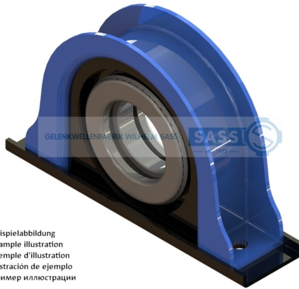
Beispielabbildung Example illustration Exemple d'illustration Ilustración de ejemplo Пример иллюстрации

D1= Lagerdurchmesser inner diamter of bearing