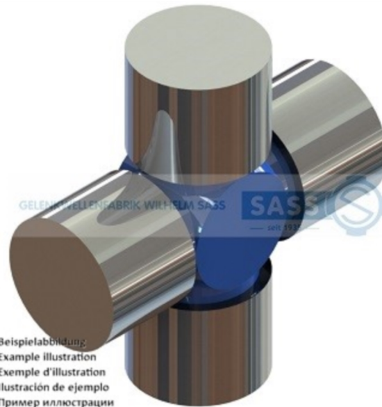
Beispielabbildung: Example illustration Exemple d'illustration Ilustración de ejemplo Пример иллюстрации