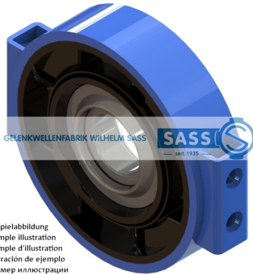
Beispielabbildung Example illustration Exemple d'illustration Ilustración de ejemplo Пример иллюстрации

D1= Lagerdurchmesser inner diamter of bearing